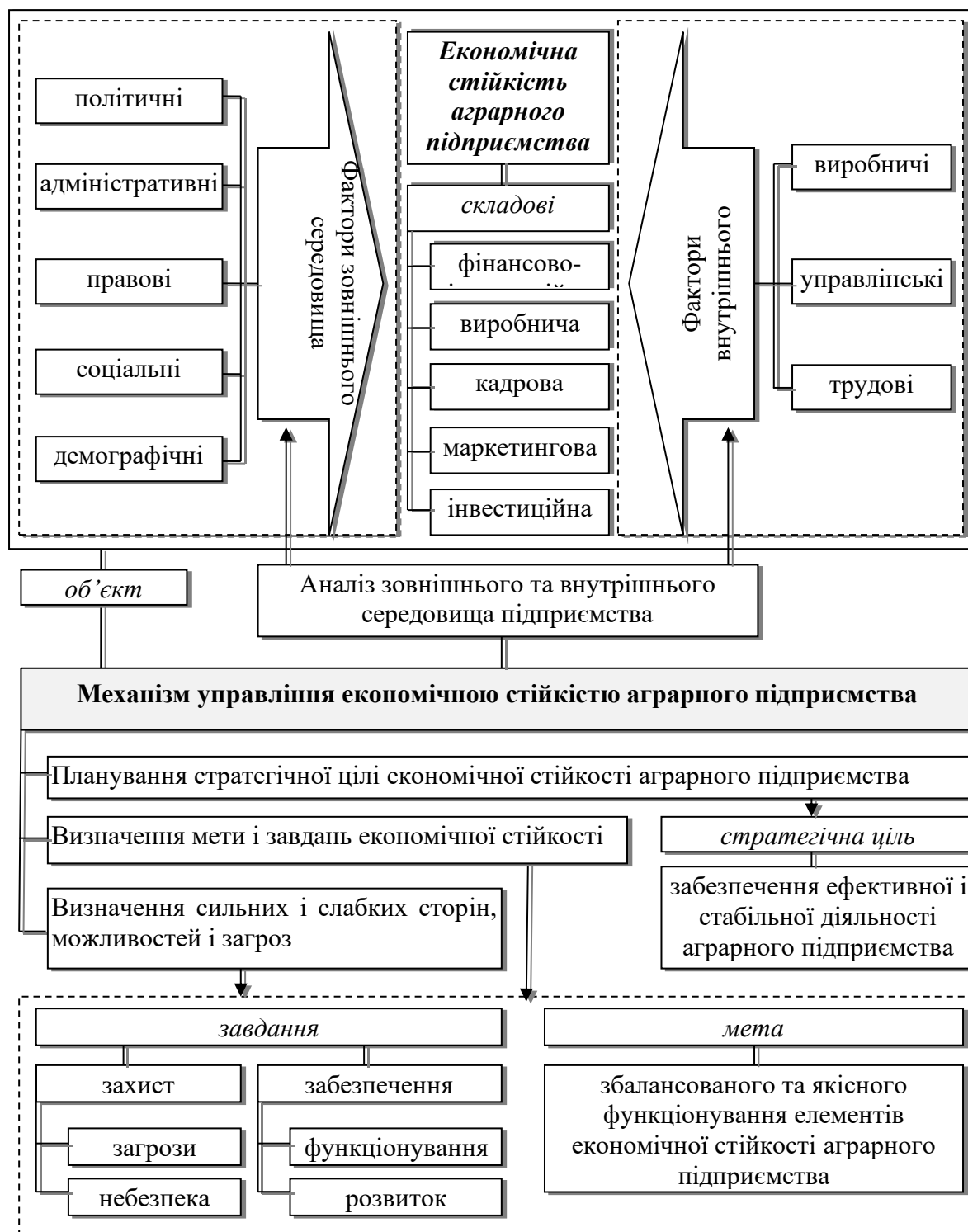
Рис. 3. Механізм управління економічною стійкістю аграрного підприємства, заснований на інтегрованому системно-адаптивному методичному підході

Для забезпечення реалізації розробленого механізму управління економічною стійкістю аграрного підприємства необхідна реалізація методичного забезпечення обґрунтування вибору стратегії досягнення економічної стійкості. Розглянуті підходи до класифікації можливих стратегій забезпечення економічної стійкості аграрних підприємств дозволяють виокремлювати такі їх типи як: стратегії виживання, стабілізації, розвитку та зростання.