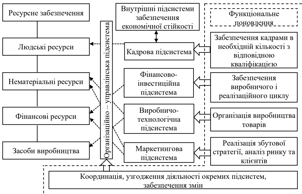
Рис. 1. Структура внутрішніх підсистем забезпечення економічної стійкості аграрного підприємства

Основні внутрішні підсистеми, що беруть на себе навантаження щодо забезпечення економічної стійкості аграрного підприємства, можна умовно поділити на підсистеми ресурсного забезпечення (виробничо-технологічну, фінансову, маркетингову, кадрову) та координаційну підсистему (організаційно – управлінську) (рис. 1).