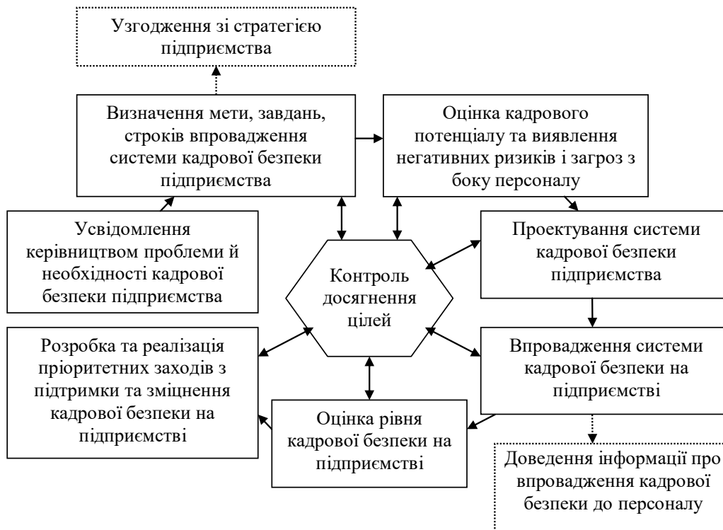
Рис. 2. Імплементация механізму дотримання кадрової безпеки в системі управління кадровою безпекою підприємства

При цьому визначальним при формуванні системи забезпечення кадрової безпеки є стратегія кадрової безпеки підприємства, яка являє собою сукупність пріоритетних цілей і управлінських підходів, реалізація яких забезпечує захист підприємства від будь-яких загроз, пов'язаних з кадрами.