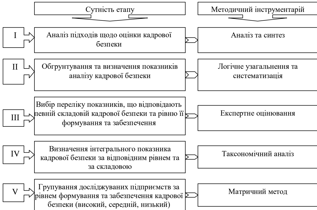
Рис. 4. Процедура визначення рівня дотримання кадрової безпеки аграрного підприємства

В дослідженні також запропоновано методичний підхід до оцінки рівня кадрової безпеки аграрних підприємств, в основу якого покладено комплексну оцінку впливу ризикових факторів дотримання підприємством кадрової безпеки, яка здійснюється з використанням сучасних методів аналізу зовнішнього середовища, експертного оцінювання внутрішньо-організаційних тенденцій управління персоналом та економіко-статистичного оцінювання динаміки рівня кадрової безпеки підприємства (рис. 4).