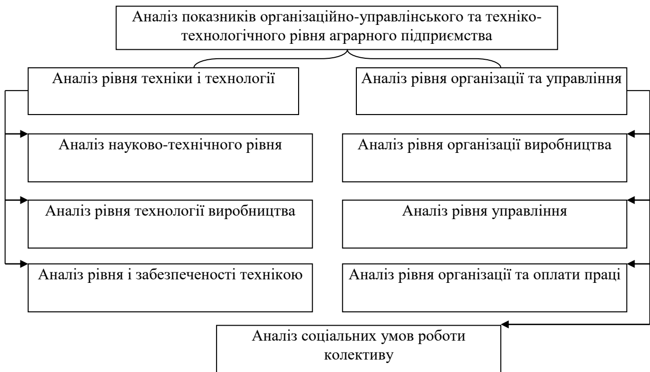
Рис. 3. Система показників аналізу організаційно-управлінського та техніко-технологічного рівня операційної системи аграрного підприємства

Розроблено концепцію та модель динамічного внутрішнього стратегічного аналізу аграрних підприємств, що базується на інтеграції ринкового й ресурсного підходів до стратегії. У модель введені аналітичні блоки, що забезпечують урахування динамізму зовнішнього середовища й можливих кризових ситуацій на аграрних ринках. Модель динамічного внутрішнього стратегічного аналізу включає блоки аналізу та оцінки стратегічних активів підприємства (включаючи виявлення стратегічних активів для виходу на нові галузеві і географічні ринки, і оцінку динамічних здібностей), а також визначення стратегічних активів, які необхідні підприємству для збереження стійкості конкурентної переваги і посилення здатності долати кризові ситуації на ринках. Центральним положенням концепції є орієнтація внутрішнього стратегічного аналізу на стратегічну перспективу, включаючи аналіз стратегічних факторів успіху й виживання.