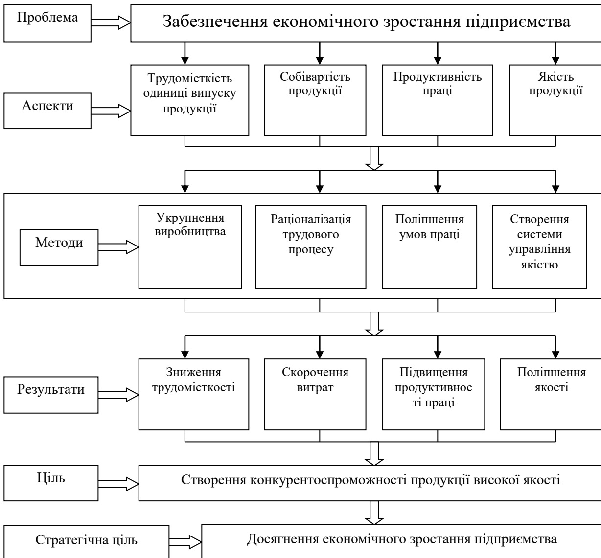
Рис. 2. Ідентифікація напрямів забезпечення економічного зростання підприємства засобами вдосконалення операційного менеджменту

Вказане сприяє досягненню стратегічно важливої мети, яка полягає у створенні конкурентоспроможного продукту високої якості, затребуваного ринком і такого, що забезпечує підприємству стійке економічне зростання.