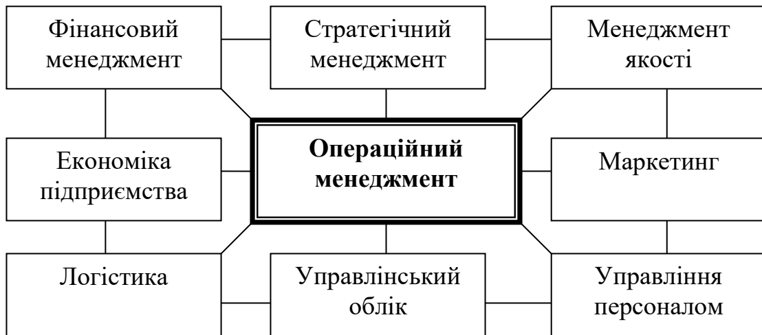
Рис. 1. Взаємозв'язок операційного менеджменту з іншими функціональними сферами менеджменту

якості та інші функціональні сфери менеджменту (рис. 1).