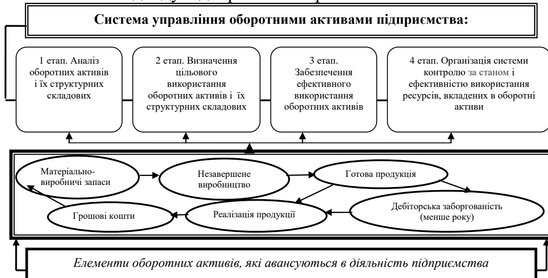
Рис. 3. Етапи ухвалення рішень при управлінні оборотними активами підприємства на основі системного підходу

Етапи ухвалення рішень при управлінні оборотними активами підприємства на основі системного підходу відображені на рис. 3.